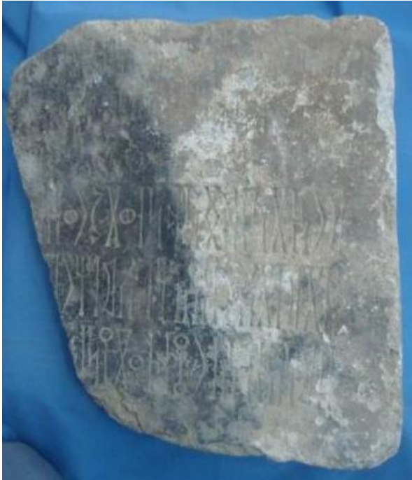
صورة ٢: النقش UAM 516

وربما أن هناك نقش آخر يوضع بجانب النقش الموجود. وتوجد على واجهة النقش طبقة سوداء (فحم) آثار حريق.