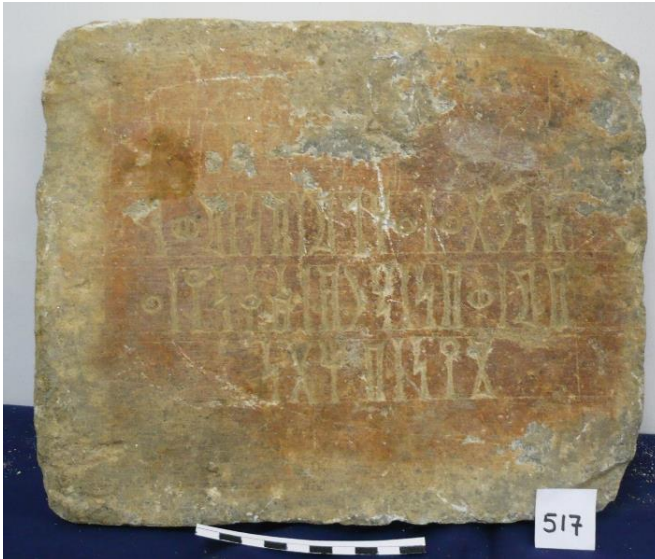
صورة ٢: النقش UAM 517