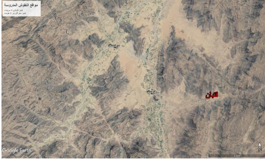
خريطة تبين الموقعين هجر حنو الزير وهجر العادي في وادي حريب. جوجل إيرث